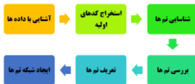
شکل ۱. تحلیل مضمون براون و کلارک (۲۰۰۶)

تجزیه و تحلیل داده‌ها در سه مرحله کلی انجام شد. ۱: کدگذاری باز (شناسایی موضوعات، ویژگی‌ها و زمینه‌ها)، ۲: کدهای محوری (دسته بندی موضوعی)، و ۳: کدهای انتخابی یا مضامین فراگیر. در مرحله کدگذاری باز، متن پیاده‌شده مصاحبه‌ها به صورت خط به خط کدگذاری شده است. در این مرحله کدهای باز و مقولات اولیه به دست آمدند. در مرحله کدگذاری محوری، مقولات اصلی بر اساس مقایسه مداوم و رفت‌وبرگشتی (بین کدها، مقولات خرد و متن مصاحبه‌ها) به دست آمده و در قالب ابعاد پارادایمی قرار گرفتند. مقولات به دست آمده در این مرحله محصول تلفیق و مقایسه کدها و مقولات خرد اولیه به دست آمده در مرحله کدگذاری باز بود. در مرحله کدگذاری انتخابی، مقوله اصلی استخراج شده و پیوند آن با مقولات اصلی دیگر بررسی شدند پس از شکل‌گیری مدل طراحی شده، نیاز بود که نظر مصاحبه‌شوندگان را در مورد معنادار بودن و منطقی بودن پاسخ‌ها، جویا شویم. به عبارت دیگر اعتبارسنجی نتایج انجام شد. در نتیجه در سطح ۵۰ نفر نتایج در قالب پرسش‌نامه مورد تحلیل قرار گرفته شد. در مجموع براون و کلارک (۲۰۰۶) یک راهنمای شش مرحله‌ای ارائه می‌کنند که یک چارچوب بسیار مفید برای انجام تحلیل مضمون است. در شکل ۶ گام مشخص شده است: ۱-آشنایی با داده‌ها. ۲-استخراج کدهای اولیه. ۳-شناسایی تم‌ها (دسته بندی کدها). ۴-ایجاد شبکه تم‌ها (شکل‌گیری تم‌های فرعی). ۵-تعریف تم‌ها (نامگذاری تم‌های اصلی). ۶-بررسی تم‌ها. (Braun & Clarke, ۲۰۱۳؛ Clarke & Braun, ۲۰۰۶).