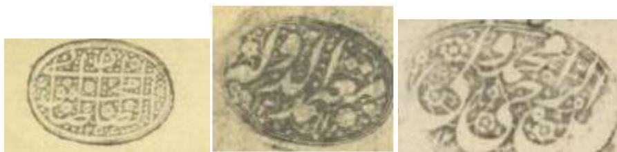
تصویر ۱: نمونه مهر با سجع های مختلف

مثال: اذا جاء نصر الله (سوره نصر، آیه یکم) برای شخصی به نام نصر الله مناسب است. گفتارها و دعاها نیز در این باب مورد توجه قرار دارد؛ از جمله المؤمن حیّ فی الدّارین، عبده الراجی لطف علی، محمد و العتره الطاهره شفیع یحیی فی الآخره، ادرکنی علی بن ابی طالب، یرجو حسن الختام السید عبد السلام. آوردن تاریخ نیز به عنوان جزئی از متن مهر مرسوم است. تصاویر زیر نمونه هایی از مهرها با سجع های مختلف: